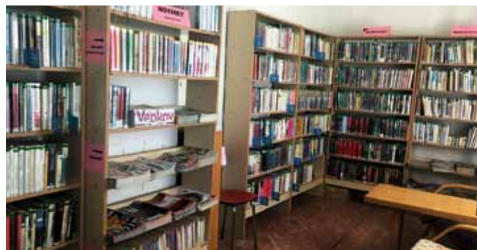
Místní knihovna Horní Bousov