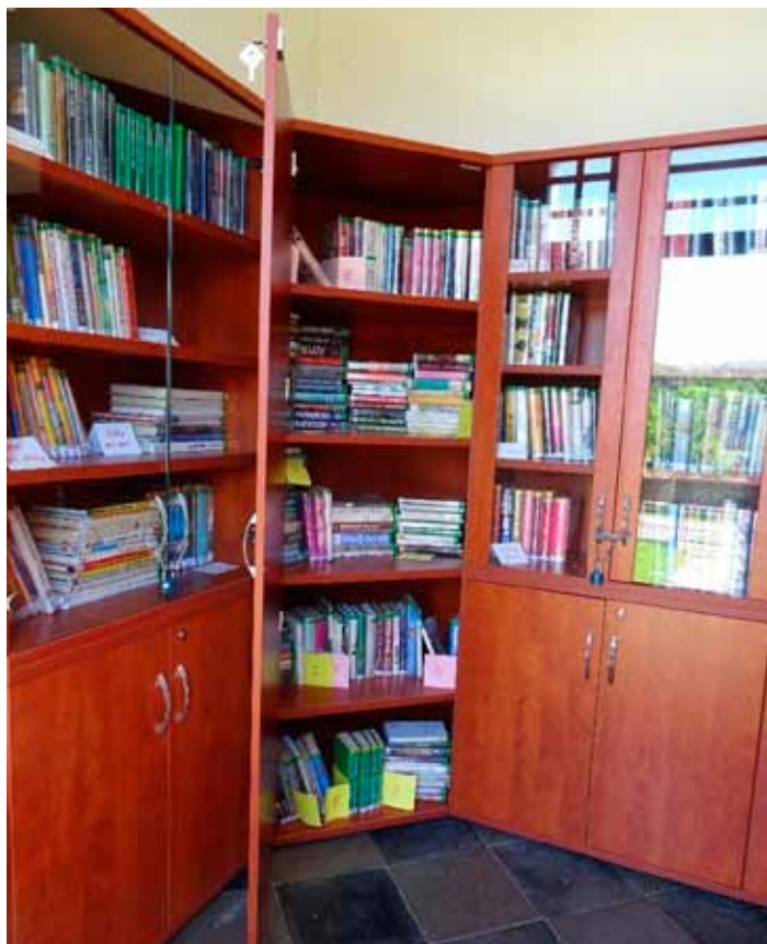
Pobočka knihovny na Bechově