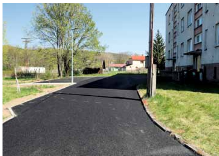
Vlčí Pole - nová přístupová cesta k bytovce a parkovací stání