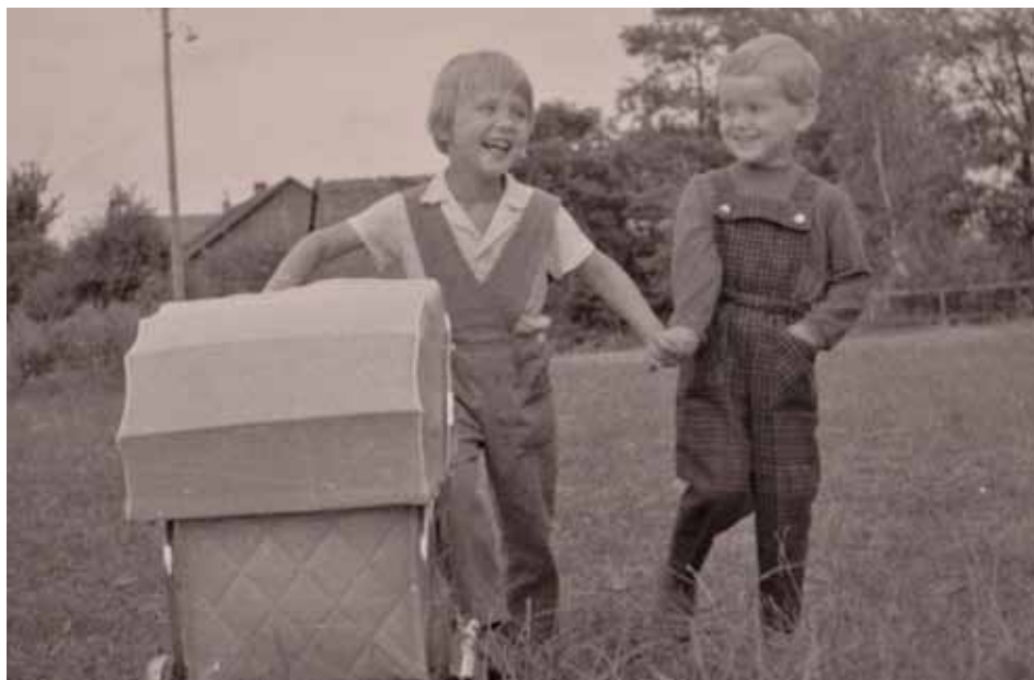
Bechov - přibližně rok 1965.

Hrávali jsme si i v opuštěných chalupách, hlavně na Bechově u Bobků. Tam jsme prolézali starou chalupu, lezli jsme na půdu, kde jsme museli dávat pozor, abychom se ztrouchnivělým stropem nepropadli dolů, lezli jsme po trámech ve stodole a pak se schovávali v seně a nakonec skákali z velké výšky dolů, nebo si dělali baráček v bývalém prasečáku. Občas jsme vlezli do stáje, kde měl ustájené koně pan Šolc, který s nimi jezdil. Někdy jsme šli na výzvědy také do kravína. Procházeli jsme mezi kravami, sledovali dění a pokaždé se trochu báli. Všechny tyto činnosti jsme měli zakázané, všem těmto místům jsme se měli vyhýbat. Mnohdy ale rodiče po čichu poznali, kde jsme zrovna ten den řádili.