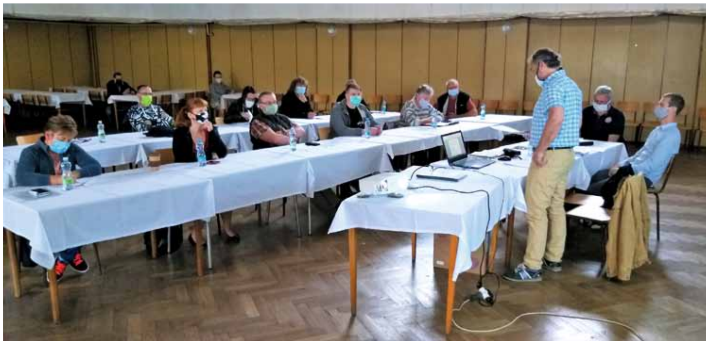
29. dubna 2020 se konalo zasedání ZM netradičně, z důvodů možnosti nákazy COVID - 19 v sále sokolovny.