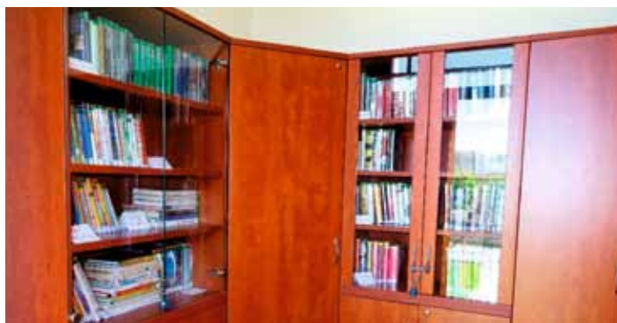
Místní knihovna Bechov