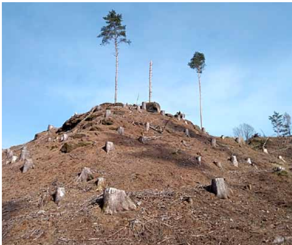
Rozsáhlé paseky kvůli kůrovci – oblast Ryka (les mezi Spařenci a Vl. Polem)

Zajímavá je vlastnost jasanu, pod nímž všechno v pohodě roste a prosperuje, protože jeho koruna propouští sluneční jas až dolů. Pro Kelty měly zvláštní postavení stromy zasvěcené dnům slunovratu a rovnodennosti. Lidé, kteří se narodili ten den, byli „miláčky bohů“. Například dub (21. 3.) zosobňuje pevnost směrem k oko-