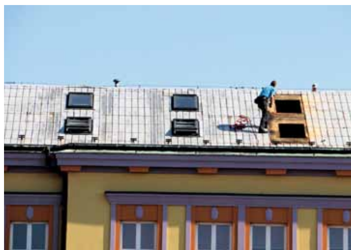
V podkroví ZŠ se dokončují jazykové učebny