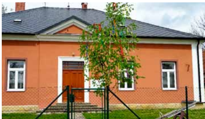
Tradice se znovu obnovuje. Před budovou bývalé školy na Bechově stála jedna ze třinácti letošních májek.