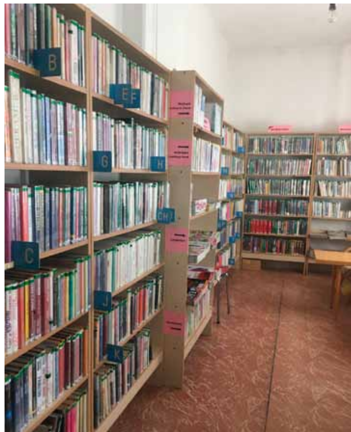
Interiér pobočky knihovny v Horním Bousově