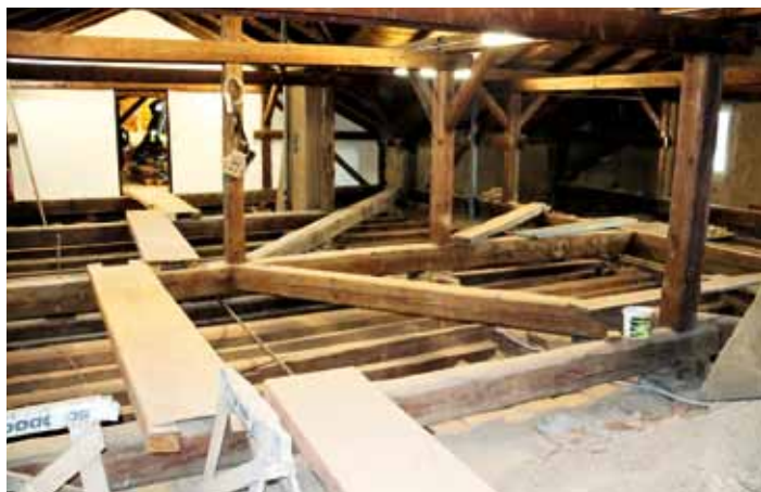
V podkroví ZŠ vznikají jazykové učebny.