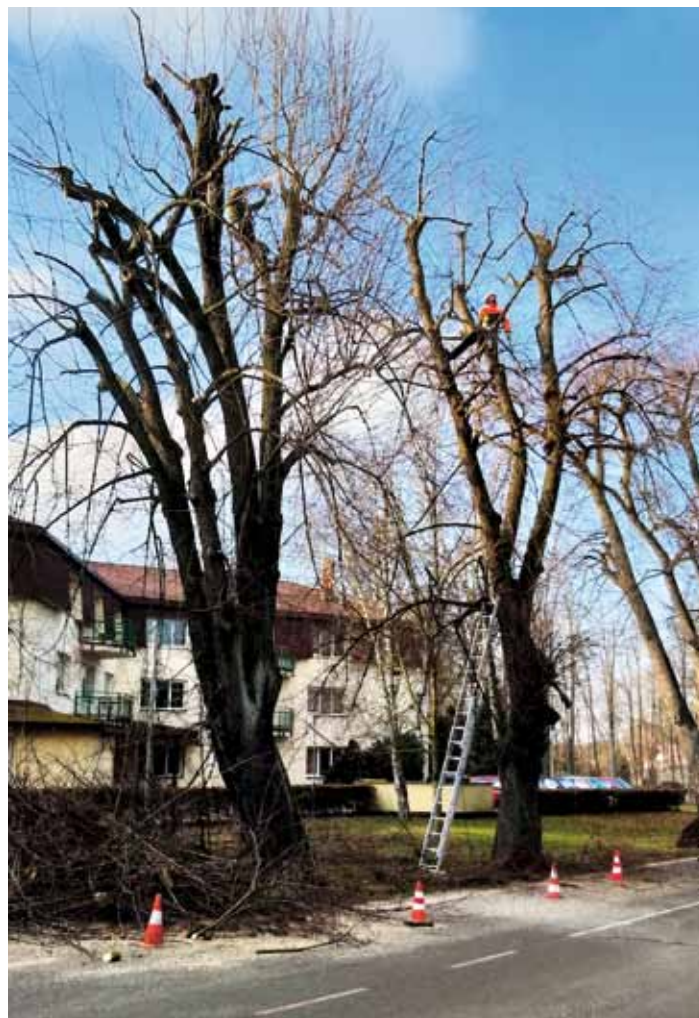
Revitalizace a údržba lipové aleje v ulici V Lipkách.