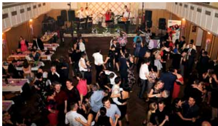
K tanci zahrála kapela Nine Orchestra.