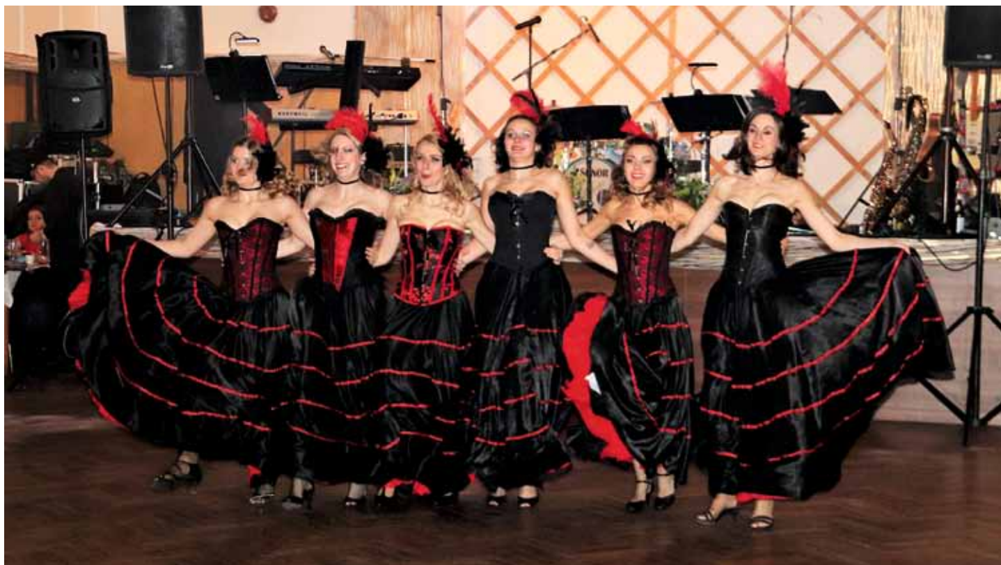
Půlnoční vystoupení boleslavské taneční skupiny Let's Burlesque!