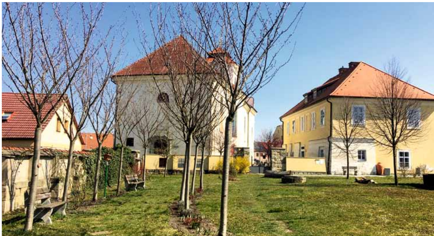
Knihovni zahrada v Kostelní ulici se připravuje na horké léto - bylo zde vysazeno 20 ks suchomilných bylin a květin.