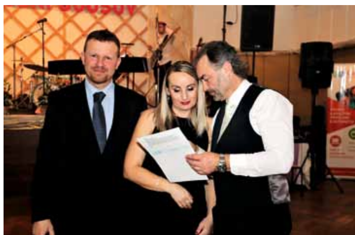
Výherkyně jedné z hlavních losovaných cen.