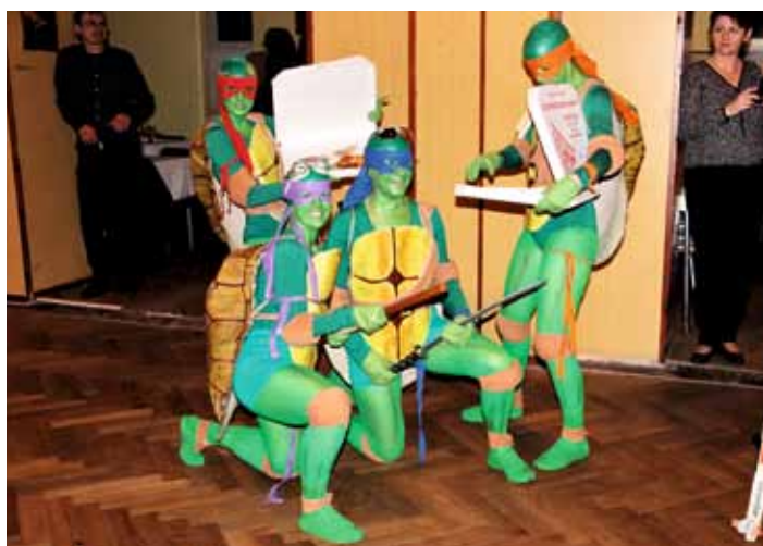
Karneval DBSK navštívily žely Ninja.