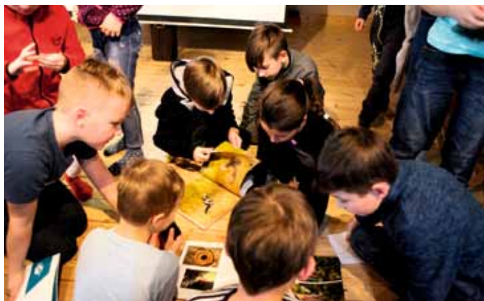
Přednáška o kukačkách pořádaná přírodovědným kroužkem byla hojně navštívena i veřejností.