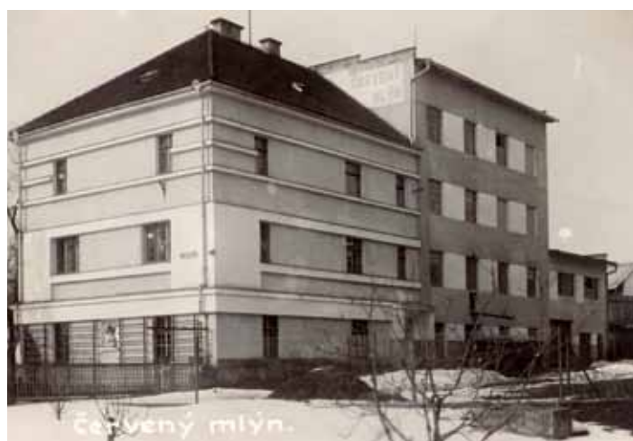
Červenský mlýn - foto k textu na str. 6.