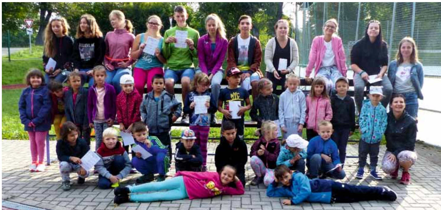
Patroni pro své svěřence uspořádali zábavné dopoledne