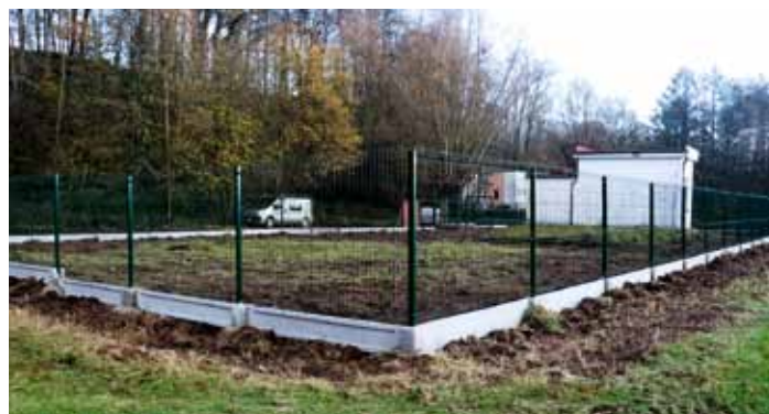
Nový plot kolem čerpací stanice vodovodu ve Střehomí