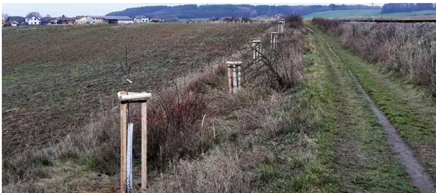
Nově osazená naučná stezka směrem k Rohatsku je lemována padesáti slivoněmi