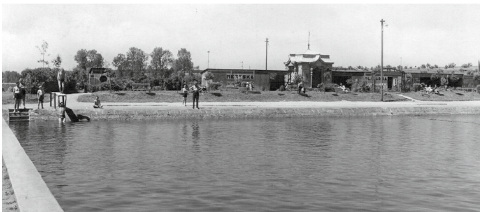
V areálu koupiště v roce 1935 stál krásný pavilon s občerstvením a převlékárny.