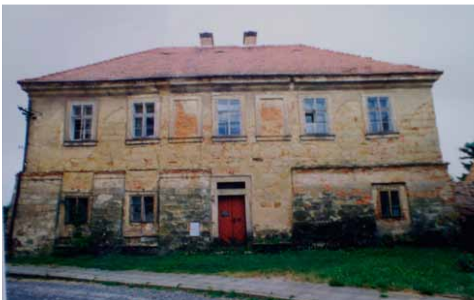
Takto zanedbaně vypadala budova bývalé fary v roce 1999

V polovině devadesátých let 20. století objekt fary koupilo město Dolní Bousov. Byly vypracovány statické a stavebně technické posudky, na jejichž základě byl vypracován projekt statického zajištění zdíva a opravy vnějších pláště, které proběhlo