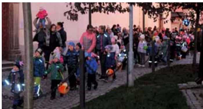
Průvod rodičů a dětí MŠ - Uspávání broučků