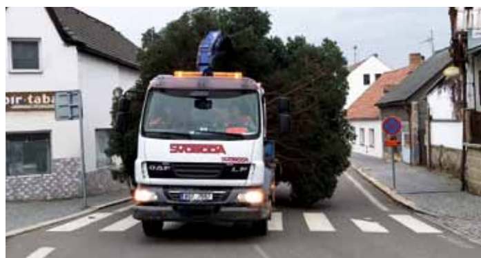
Takto se vezl letošní vánoční strom na náměstí