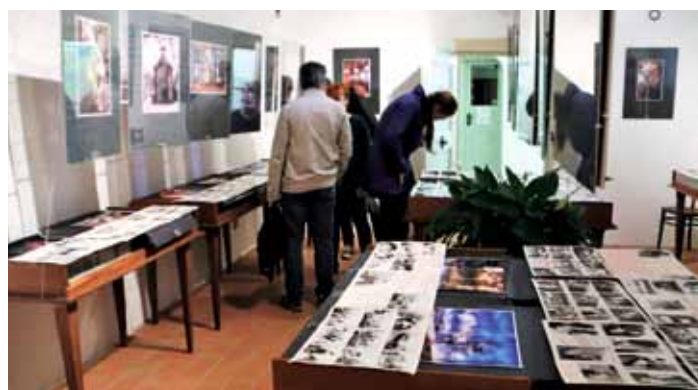
Výstava fotografií z listopadu 1989 v Bousově