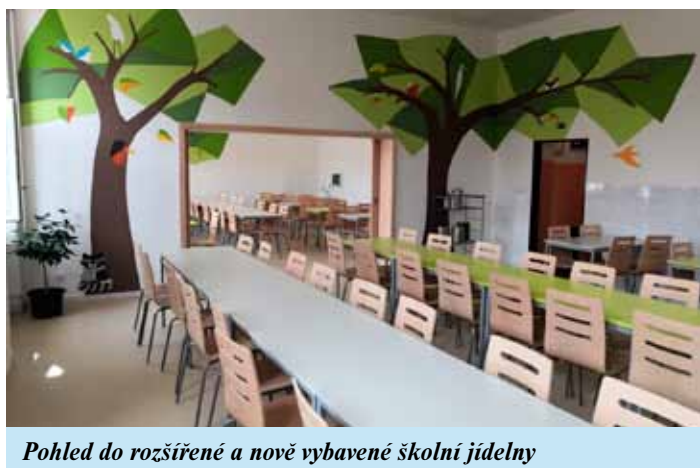
Pohled do rozšířené a nově vybavené školní jídelny