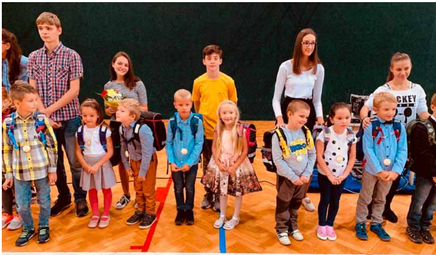
Žáci první tříd se svými patrony z řad žáků devátých tříd během prvního školního dne, který začínal ve sportovní hale