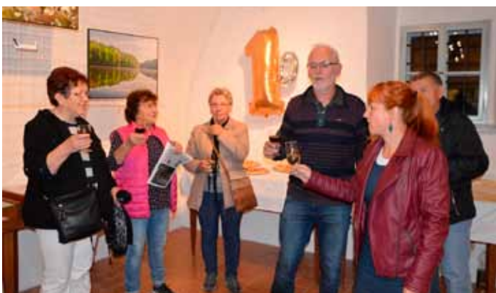
Přípitek na oslavu 10 let od otevření knihovny a IC