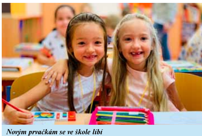
Novým prvčákám se ve škole líbí