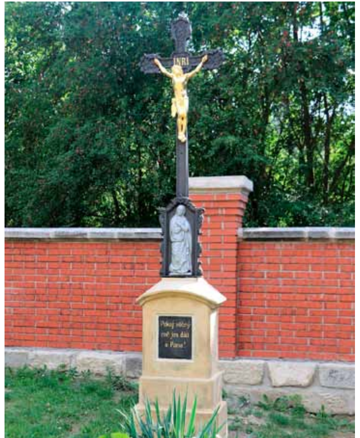
Restaurovaný kříž na hřbitově ve Vlčím Poli