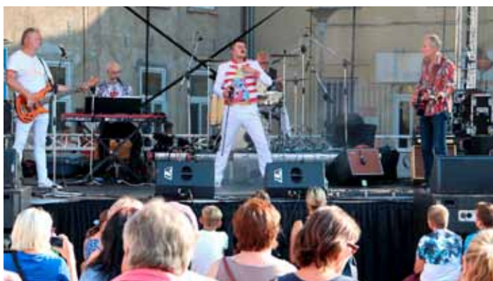
Živelné vystoupení Prague Queen