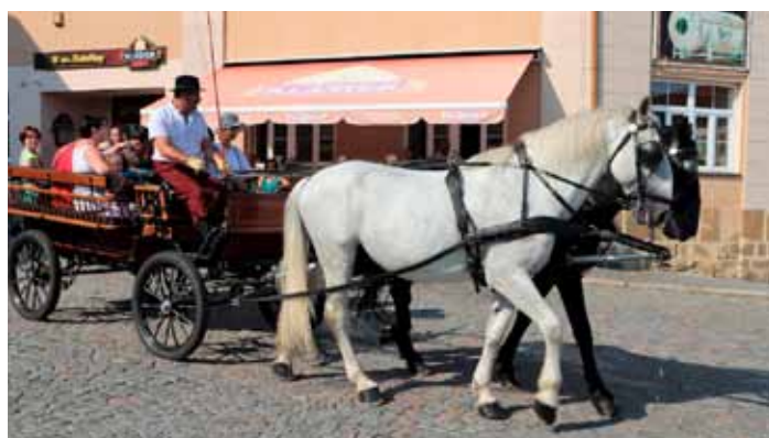
Bylo možné svážet se vozem s kladrubskými koňmi