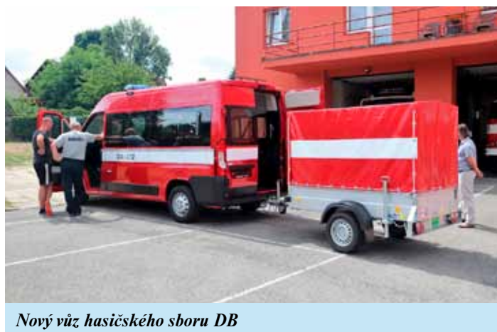
Nový vůz hasičského sboru DB