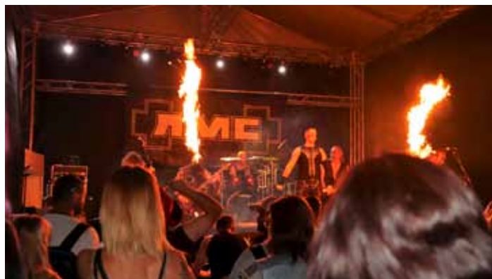
Večer zakončila kapela hrající písně skupiny Rammstein