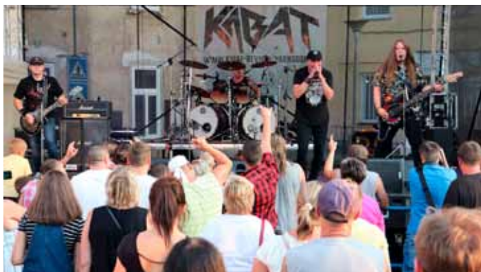
Vystoupení kapely Kabát revival Varnsdorf