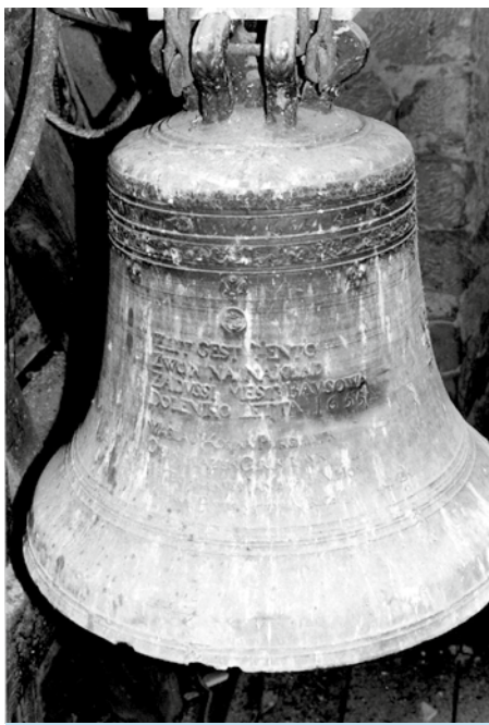
Nápis na zvonu z roku 1655

Nalezený dopis je odpovědí biskupské kanceláře jakési Charitě a potvrzuje, které zvony a kdy přesně byly dle jejich záznamů zdejší farnosti zabaveny. Kromě dvou dolnobousovských zvonů se zde také píše o třech odvezených zvonech z Markvartic (zvon sv. Cyril a Metoděj o váze 306 kg; průměr zvonu 80 cm; zvon o váze 212 kg s reliéfem sv. Václava o průměru 72 cm