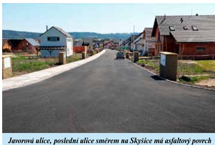
Javorová ulice, poslední ulice směrem na Skyšice má asfaltový povrch