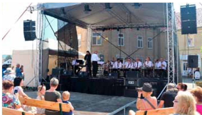
Orchestr Karla Vlacha a Bohuš Matuš