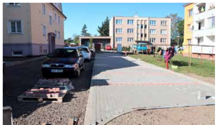
Probíhá revitalizace sídliště