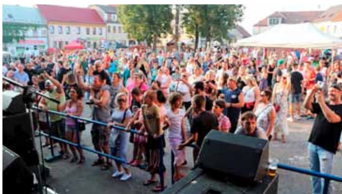
Slavnosti měly navzdory vedru velkou návštěvnost