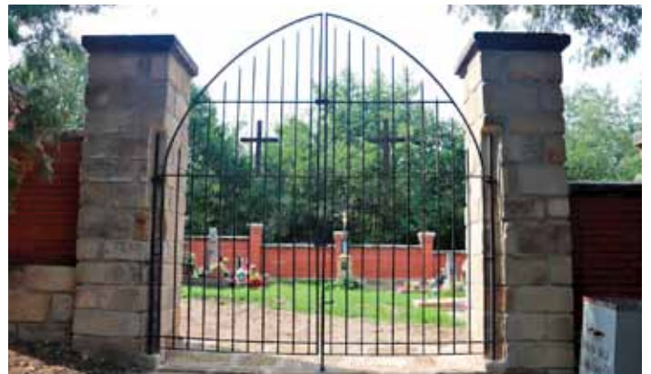
Opravená v brána na hřbitově ve Vlčím Poli