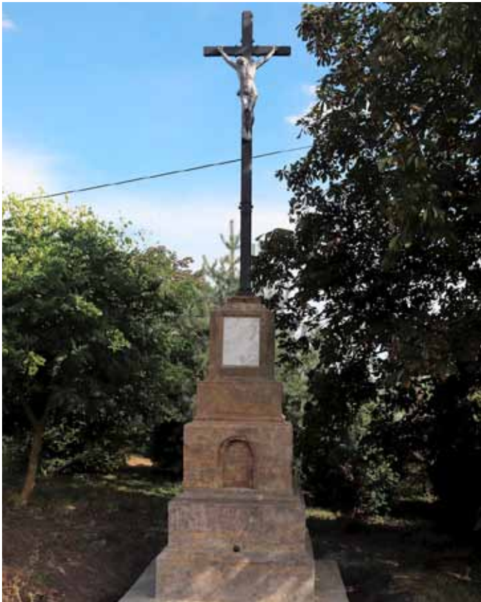
Restaurovaný kříž v Horním Bousově