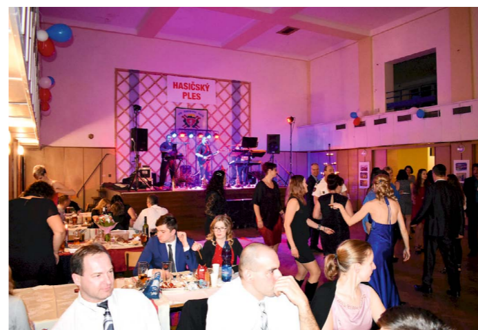
Hasičský ples v sokolovně a SDH na čarodějnicích.