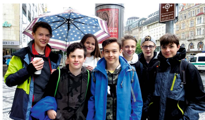
Účastníci videoworkshopu Paměť národa v Praze