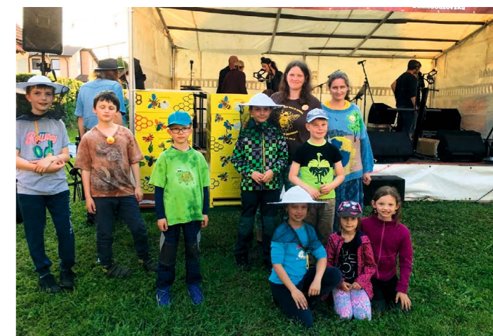
Předání úlů přírodovědnému kroužku.