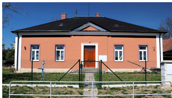
Opravená střecha a fasáda školy na Běchově