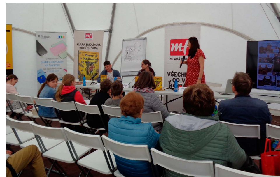
Čtenářský klub opět navštívil výstavu Svět knihy v Praze.