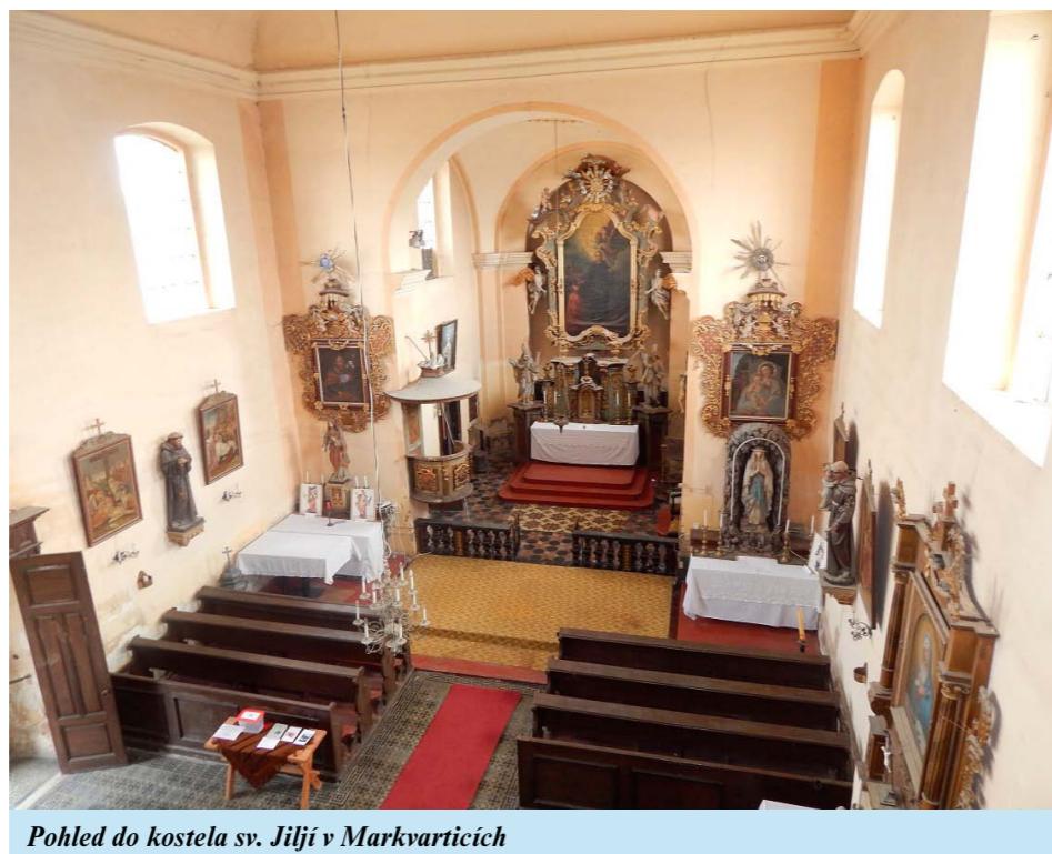
Pohled do kostela sv. Jiljí v Markvartících