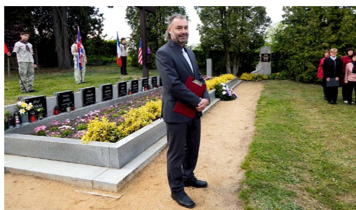
Květen - uctění památky obětí 2. světové války