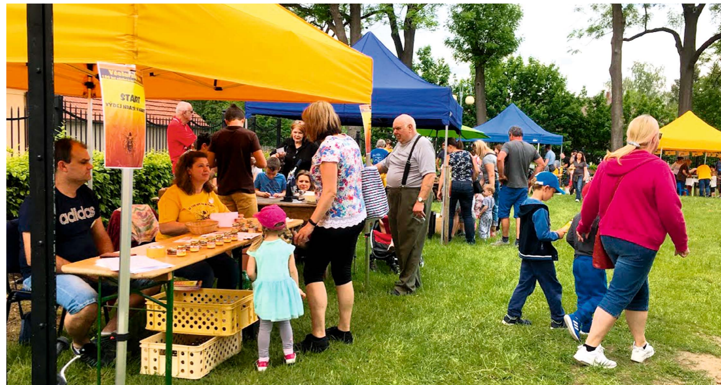
V sobotu 25. května se konala oslava 100 let od založení včelařského spolku v Dolním Bousově. Součástí slavnostního odpoledne byly soutěže pro děti motivované životem včel a také několik, hojně navštěvených, dětských představení (foto níže).

Aktuální informace a podrobnosti najdete na www.infocentrum.dolnibousov.cz a na plakátovacích plochách.