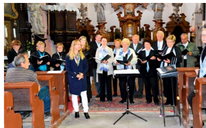
Pro nepřízeň počasí se letní koncert sboru Stojmír-Bendl konal 23. 6. v kostele sv. Kateřiny.