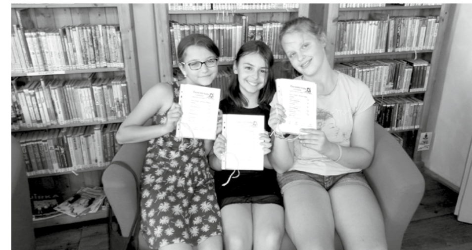
Poslední akcí čtenářských klubů bylo nocování v knihovně pro děti z druhého stupně, na něž čekalo čtenářské vysvědčení a jako bonus čtenářské vaky s vlastním logem.