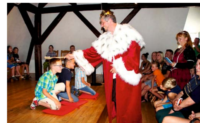
V červnu proběhlo v knihovně slavnostní pasování prvňáčků na čtenáře.