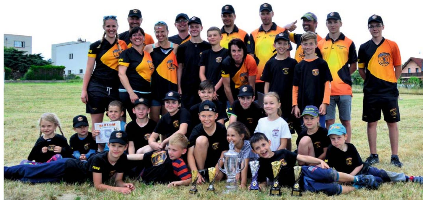
Sportovní družstva SDH Bechov po Okrskové soutěži na Dobšíně-Kamenici.

Aktuální informace a podrobnosti najdete na www.infocentrum.dolnibousov.cz a na plakátovacích plochách.