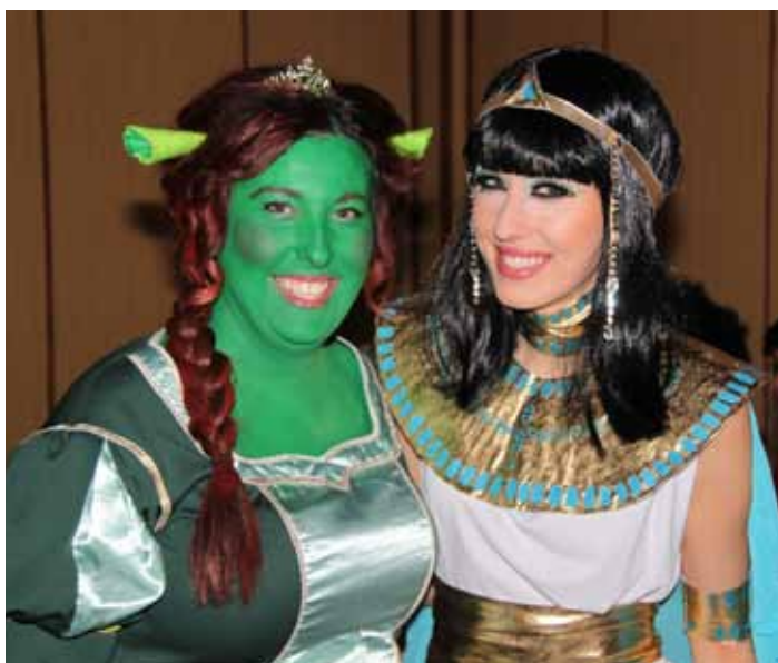
Plesová sezona byla tradičně zakončena karnevalem DBSK