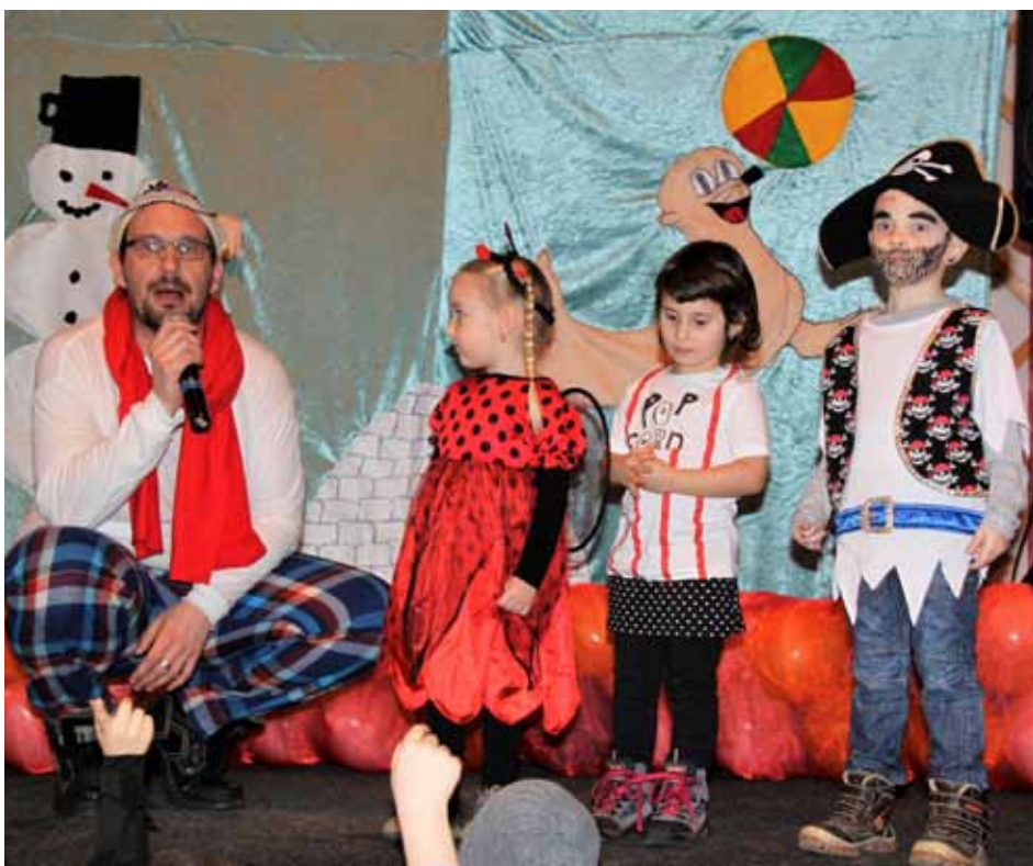
V sobotu 19. 3. se v místní sokolovně konal trochu netradiční dětský karneval s názvem Hurá za eskymáky.