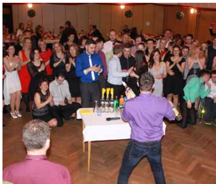
Barmanská show byla půlnočním překvapením na městském plesu