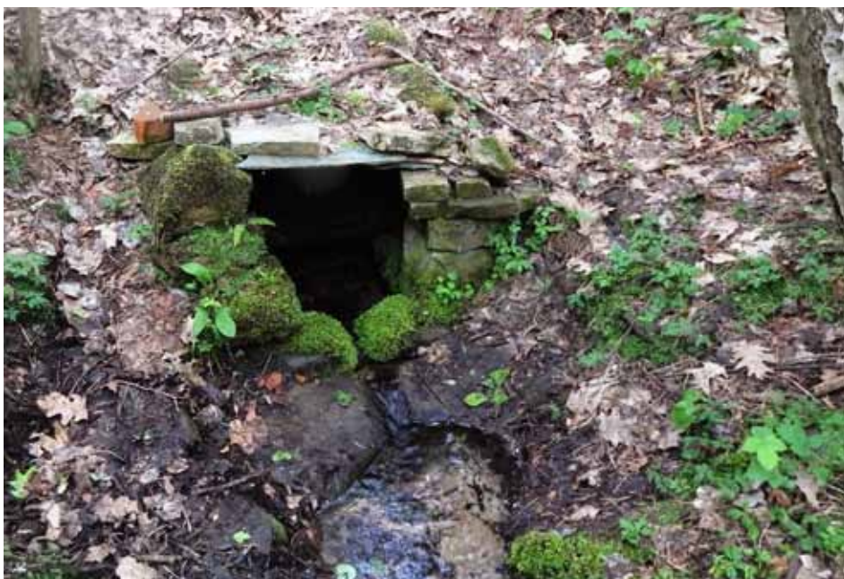
Studánka na Křížánku v roce 2016.

Další dobře udržovanou studánkou je studánka v Křížánku, někteří ji znají jako záhubskou. Nejsem odborníkem na vodu, ale znám bousováky tvrdící, že právě tato studánka má nejlepší vodu a používají ji k pití.