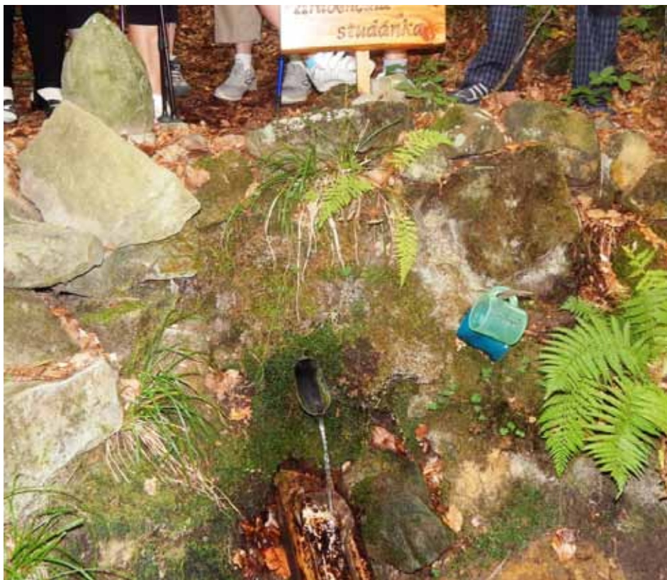
Takto vypadala Hraběčina studánka nad Vlčím Polem v dubnu 2016 při slavnostním odemykání.

Je pravda, že každý kraj měl trochu jiný rituál, ale vždy bylo patrné, že lidé si studánek vážili. Voda, pramenitá voda byla vždy ve velké úctě. Možná, že by bylo vhodné připomenout, dílo (učebnici) římského stavitele Vitruvia „Deset knih o architektuře“. Vitruvius totiž celou osmou knihu věnoval vodě, vodním zdrojům a hledání vody. Tato kniha sloužila stavitelům jako zdroj poznání téměř 2000 let. Od roku 25 před naším letopočtem až do 19. století.