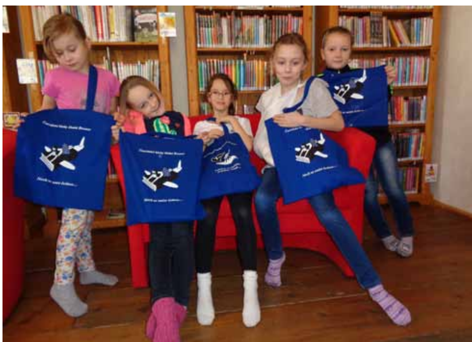
Klubová taška byla pro děti vítanou odměnou.