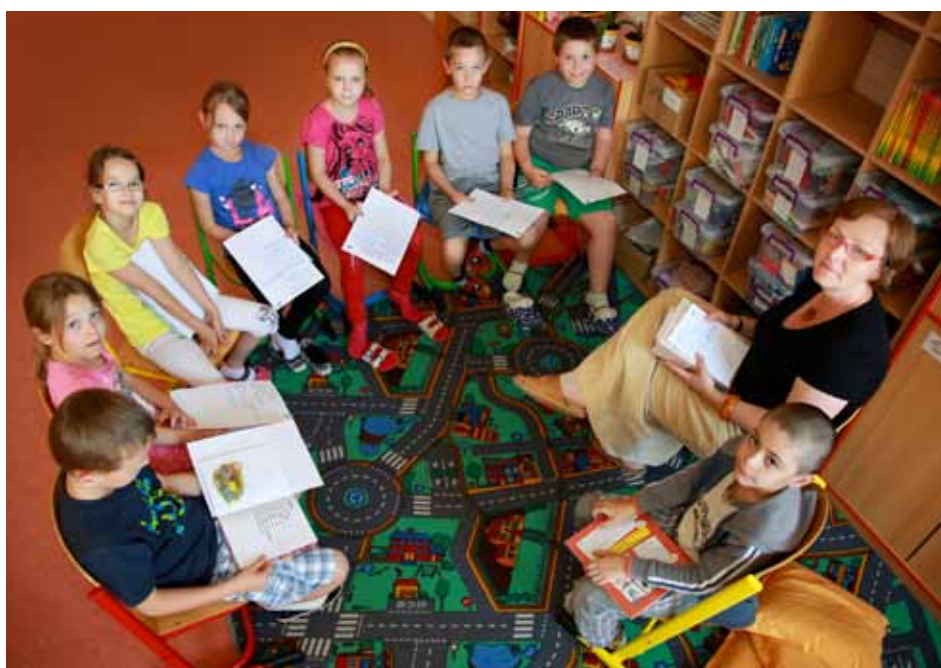
Povídání o přečtených knihách