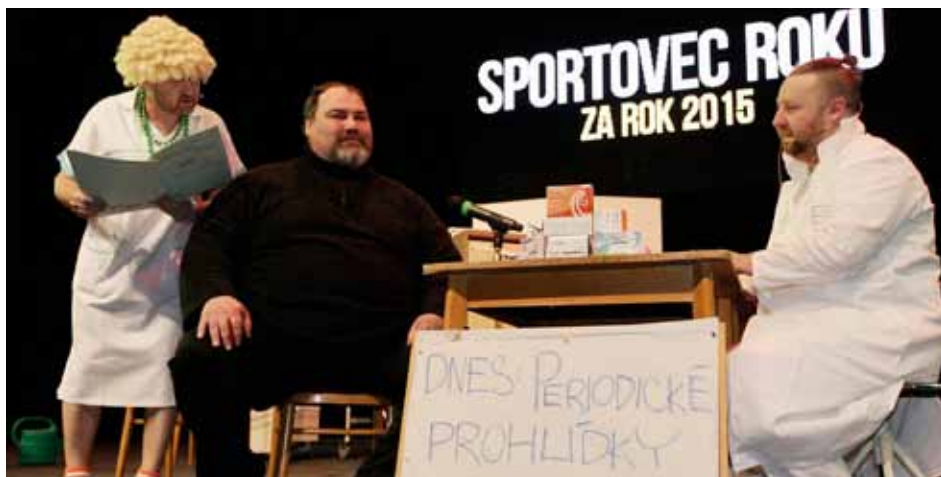
Nezapomenutelný zážitek přichystali organizátoři ankety Sportovec Mladoboleslavka 2015. Při galavečeru 23. ročníku pořadatelé nainstalovali na pódium Domu kultury ordinaci praktického lékaře, kam ocenění sportovci přicházeli nejen pro ceny, ale čekala je také periodická prohlídka.