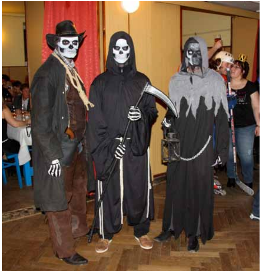
Karneval DBSK v sokolovně tentokrát navštívili vyslanci Smrtky i velebný otec.