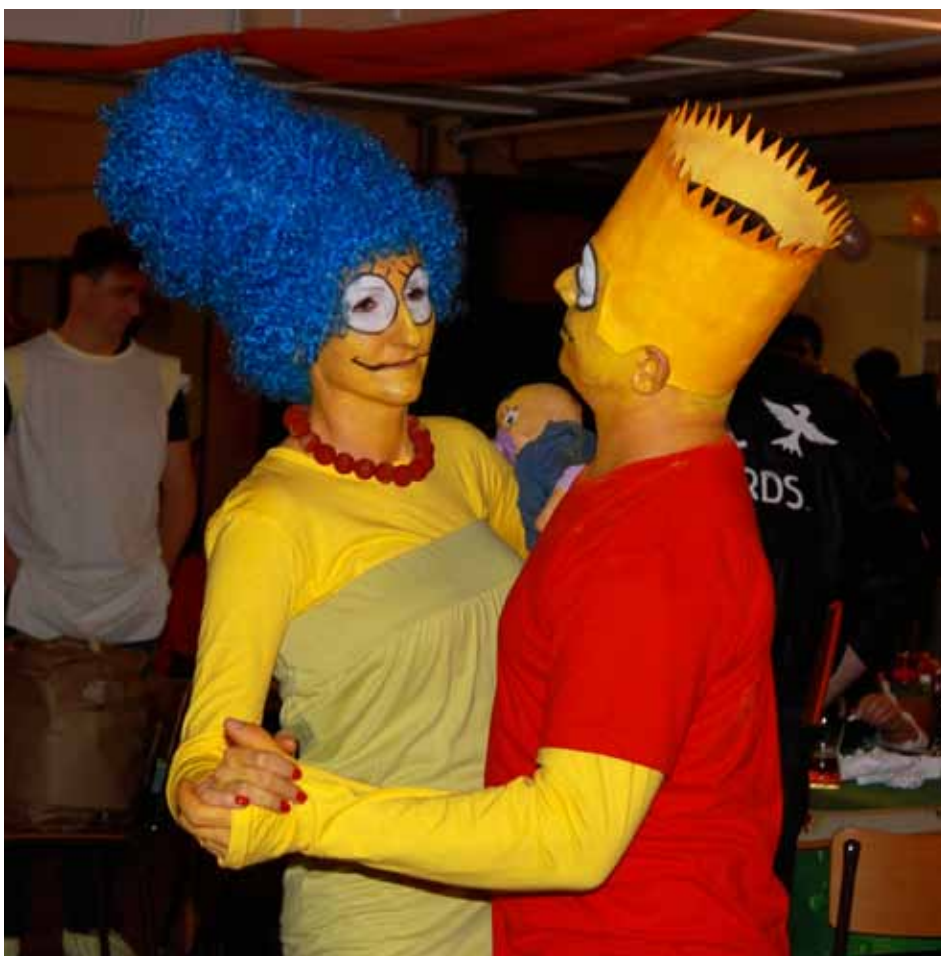
Maškarní Karneval důstojně ukončil dolnobousovskou plesovou sezonu 2016. Místní sokolovnu zaplnilo asi tři sta hostů a z toho bezmála stovku tvořily masky.