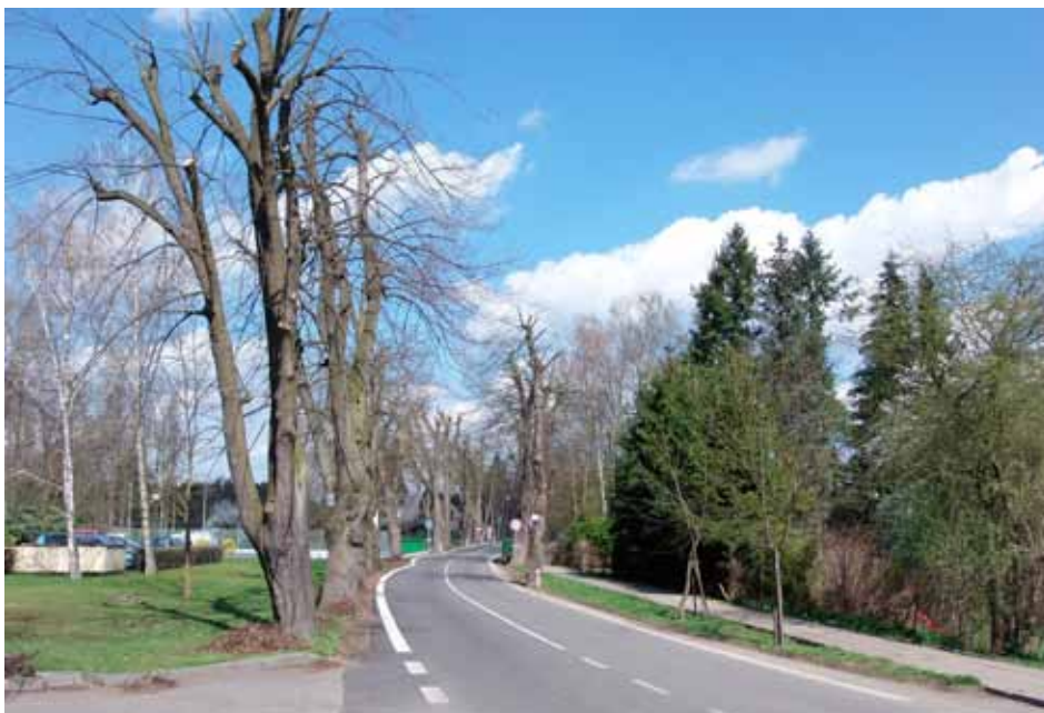
Pohled do prořezané aleje V Lipkách, článek na str. 5