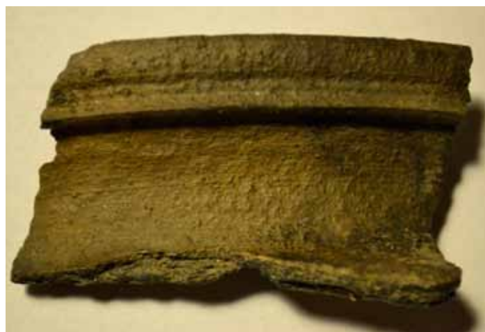
Obr. 3 - další z úlomků keramiky z lokality mezi hradištěm Poráně a Vescem, nad Veseckým potokem, nález z roku 2015.