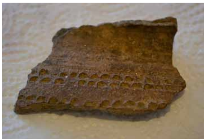
Obr. 2 - úlomek keramiky z lokality mezi hradištěm Poráně a Vescem, nad Veseckým potokem.