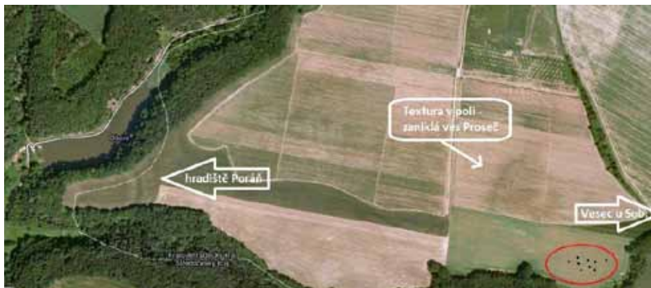
Obr. 1 - letecká mapa Poráně; v červeném oválu vyznačené naorané černé skvrny s úlomky keramiky.

rozhodl navštívit lokalitu a ověřit možnost bývalého osídlení v souvislosti se zaniklou vsí Proseč.