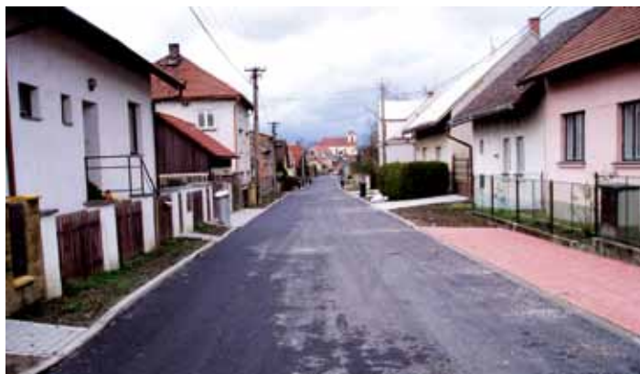
Čerstvě opravená ulice V Kališti.