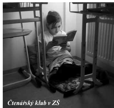
Čtenářský klub v ZŠ