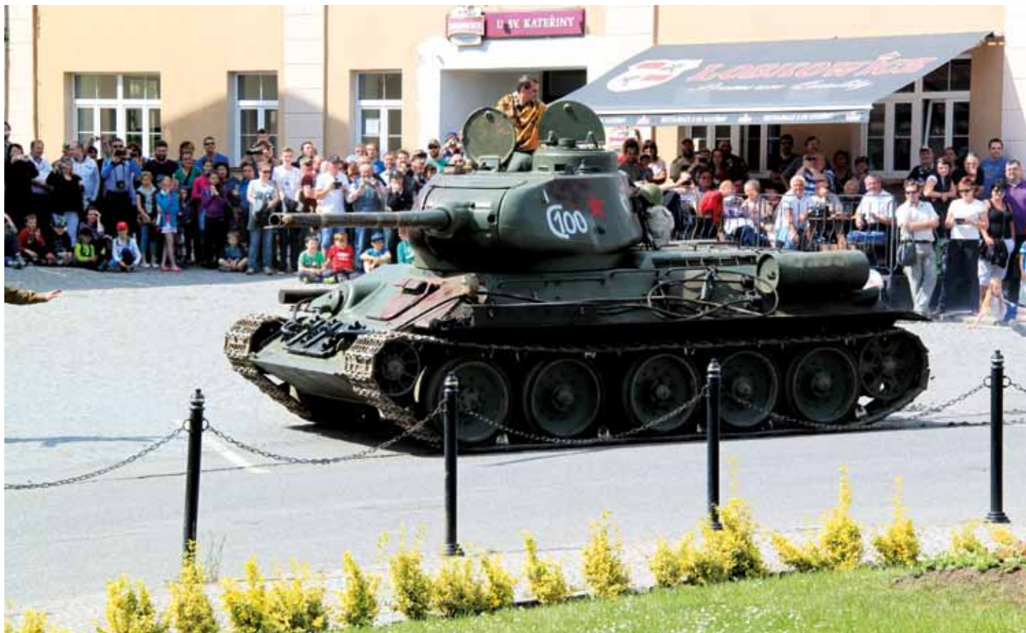
Bojová ukázka historického klubu SPVH Sever na náměstí TGM během květnových oslav