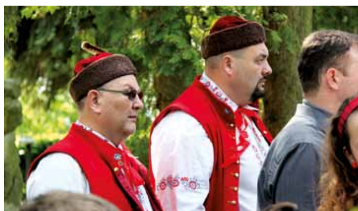
Bousovští baráčníci na oslavách 75. výročí konce války