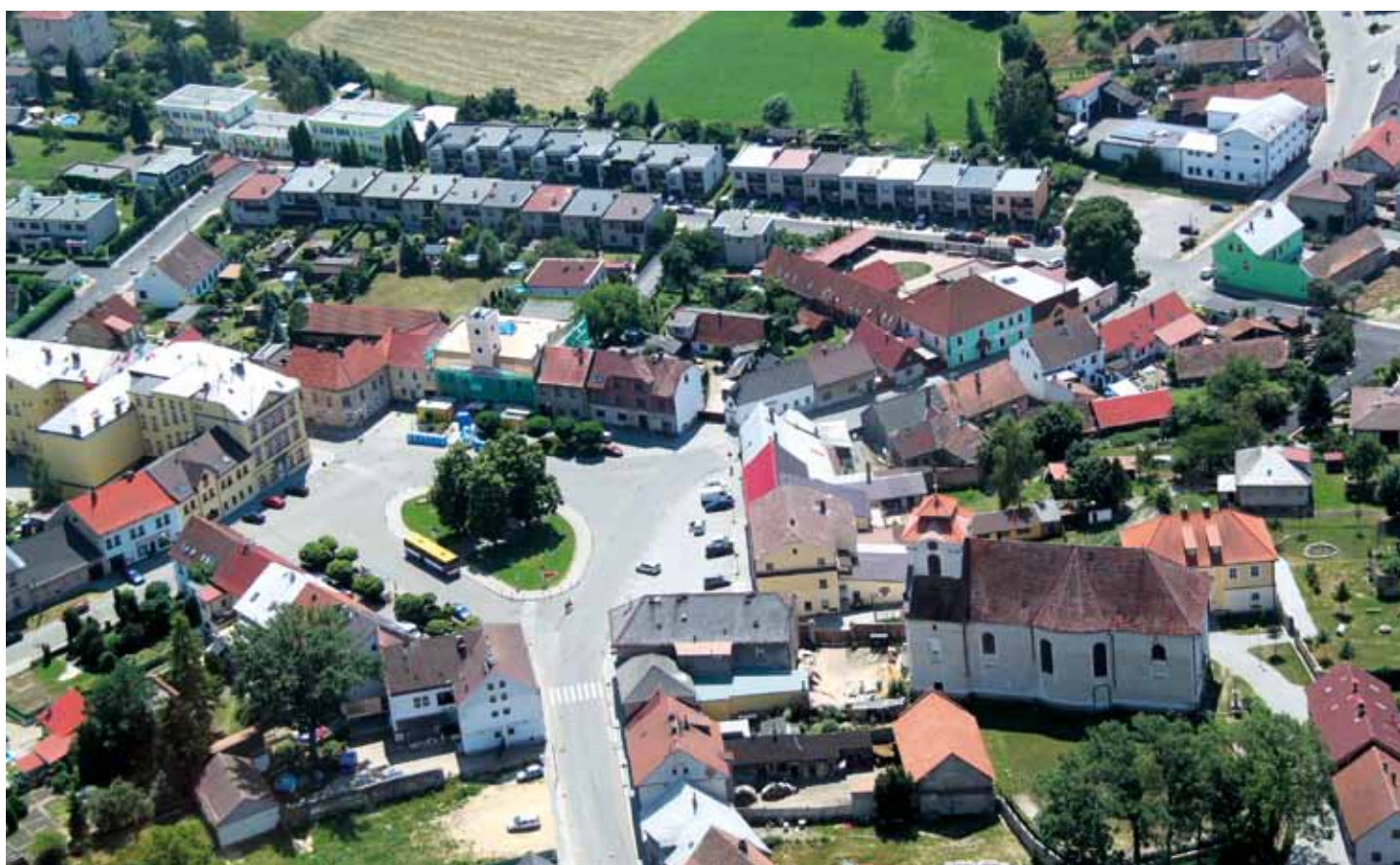
Letecký pohled na centrum Dolního Bousova v létě 2015.