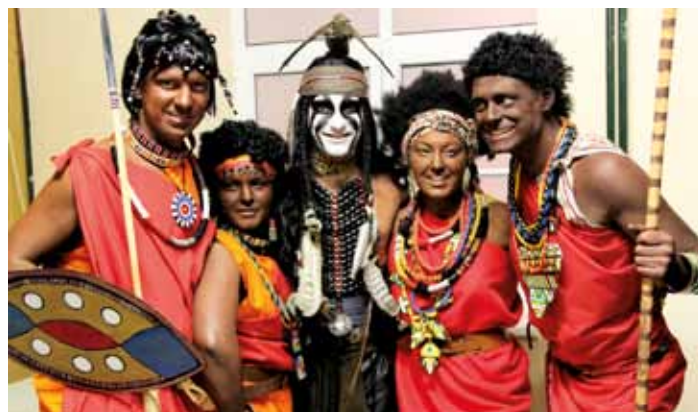
Karneval DBSK - vítězné masky, březen 2015