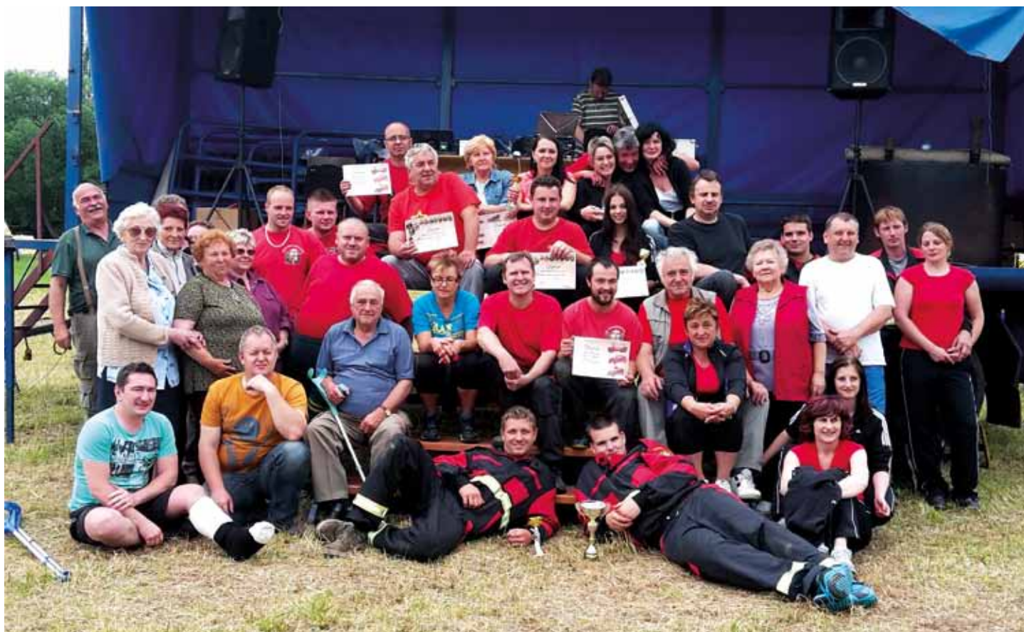
Společné foto z 9. ročníku Vlčopolské kapky, červen 2015.