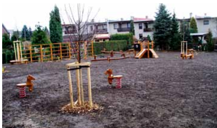
Zahrada v přírodním stylu u nové MŠ na rohu náměstí.