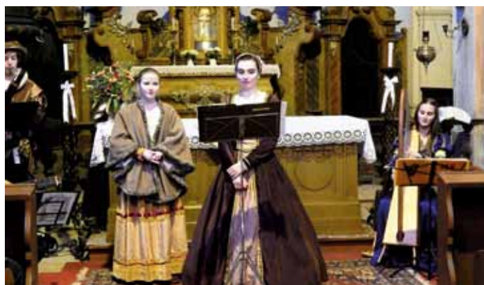
Na květnové noci kostelů vystoupila liberecká Musica Viva.