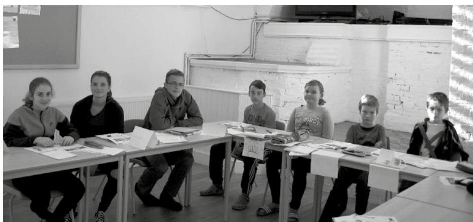
Výuka anglického jazyka ve škole LTC Eastbourne.

Celý týden jsme byli ubytováni v 500 let staré budově LTC Eastbourne. Zvenku vypadala pěkně, ale uvnitř připomínala labyrint. Bydleli jsme v šesti a vícelůžkových pokojích. V celé budově bylo několik učeben, z nichž tři jsme využívali. Dále jsme měli jídelnu, kde jsme si mohli vybrat mezi několika pochoutkami. V jídelně jsme měli plnou penzi. V budově jsme nebyli jediní studenti, byli tu s námi Francouzi a Kolumbijci. V rezidenci LTC Eastbourne se nám moc líbilo a pobyt jsme si tam moc užili.