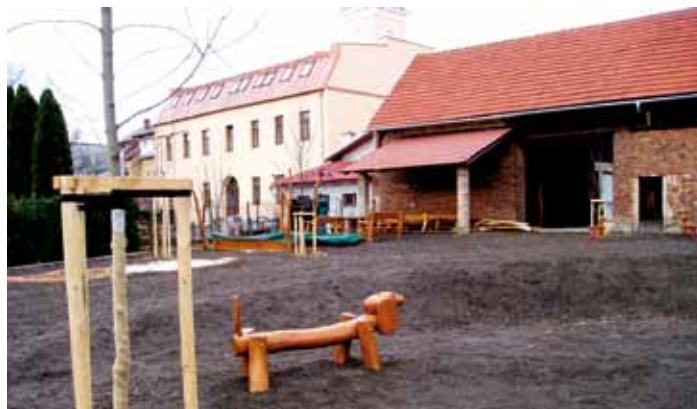
Nová zahrada u MŠ, v pozadí opravená zadní strana radnice.