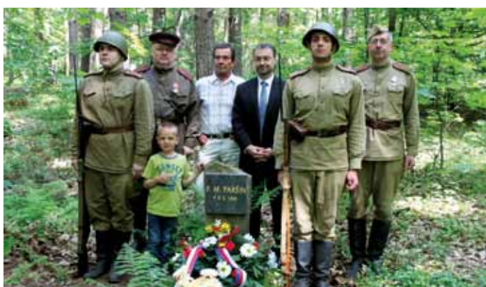
75 let od konce 2. sv. v. – u pomníku u silnice na Spařence