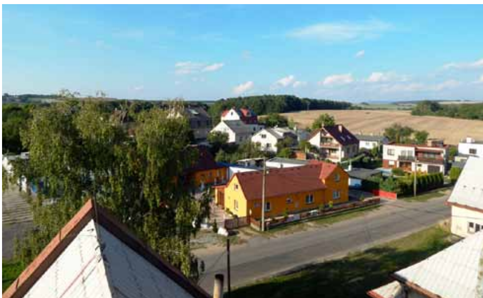
Rozhled do kraje z vodárenské věže bývalého cukrovaru.