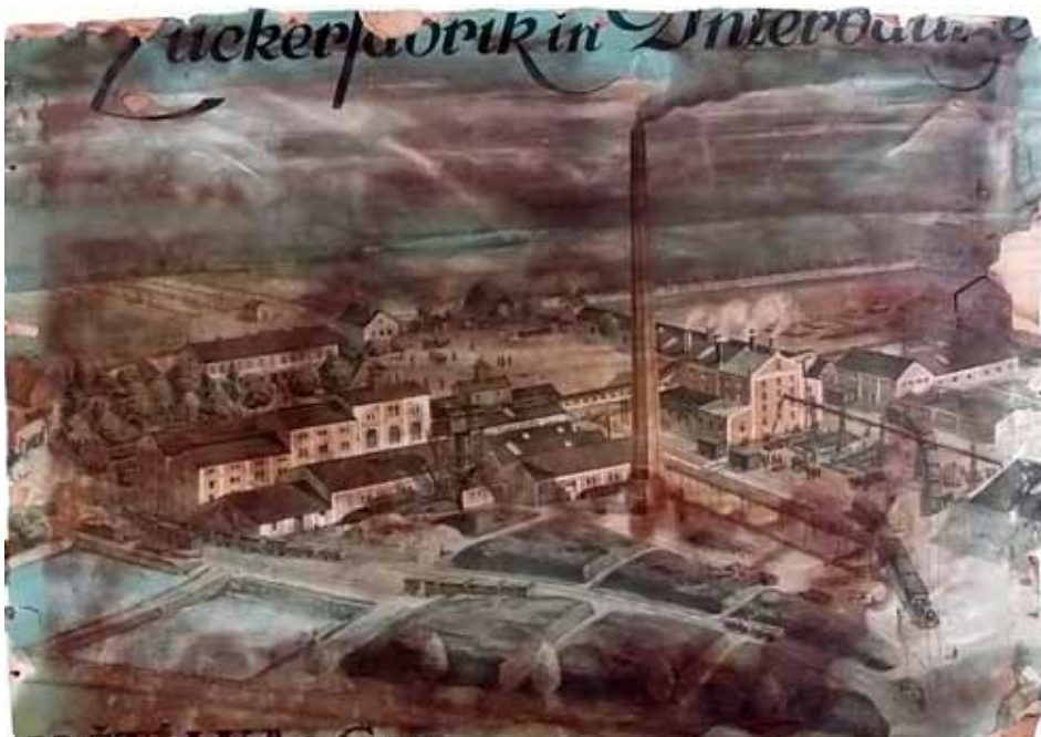
Letecký pohled na cukrovar - obraz z let těsně po jeho založení, cca kolem r. 1880 - ještě před přístavbou administrativní budovy s vodojemem.