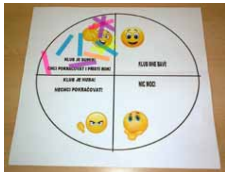
Děti hodnotí čtenářský klub velmi pozitivně

V minulém čísle Bousováku jste si mohly přečíst dopis klubové čtenářky Terezy Dlaskové. Dopis byl reflexí našeho výletu