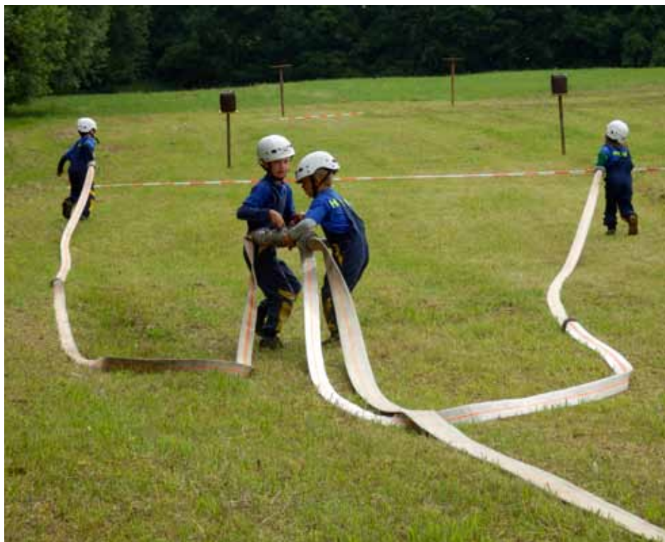
Příprava SDH Bechov požární útok - Vlčopolská Kapka

Do prázdnin jsme pak stihli ještě dvě soutěže. Nejprve děti na poháru Škoda Auto získaly třetí místo a týden poté na Vlčopolské kapce místo druhé a třetí. Kapky se po delší soutěžní odmlce zúčastnila i příprava a dvěma prvními místy z útoku a štafety dala jasně najevo, že doma zůstat nechce.