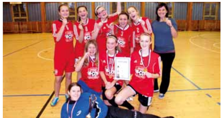
1. místo v kraj. finále florbalu dívek 8. a 9. tříd v K. Hoře, 9. 12.