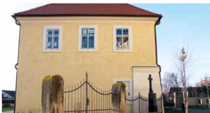
Adventní kalendář pro kolemjdoucí svítí za okny knihovny