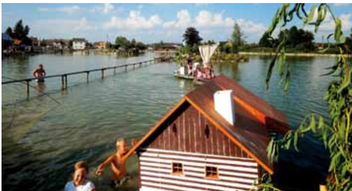
2. ročník neckyády na rybníce Pískovák, 17. 8. 2014