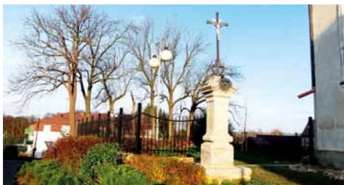
Čerstvě natřený nový plot a rekonstruovaný křížek u kostela, listopad 2014