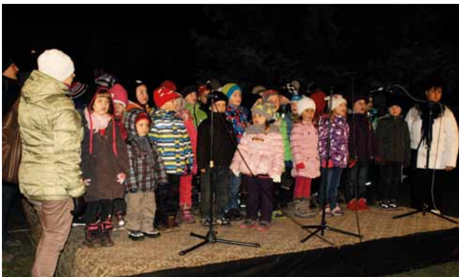
Při slavnostním rozsvícení vánočního stromu na náměstí TGM zapěvaly u živého betléma děti z mateřské školky.