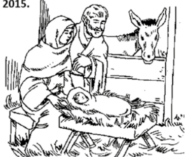
Přeji Zahradnické služby Soňa Nechanská

Příjemné prožití svátků Vánočních, hodně zdraví a štěstí v Novém roce 2015.