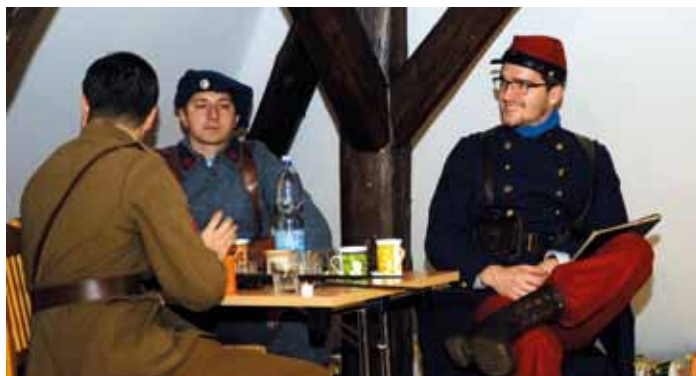
Z besedy o dolnobousovských legionářích, knihovna, 21. 11.