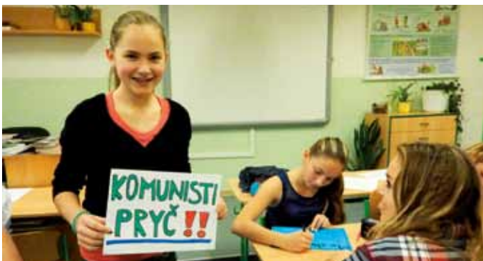
Jak to bylo v listopadu 1989 v D. Bousově, více str. 11