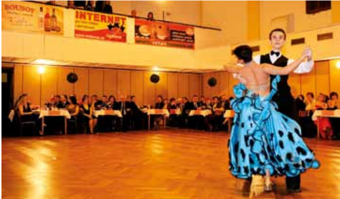
3. ples města Dolní Bousov, 22. 2. 2014