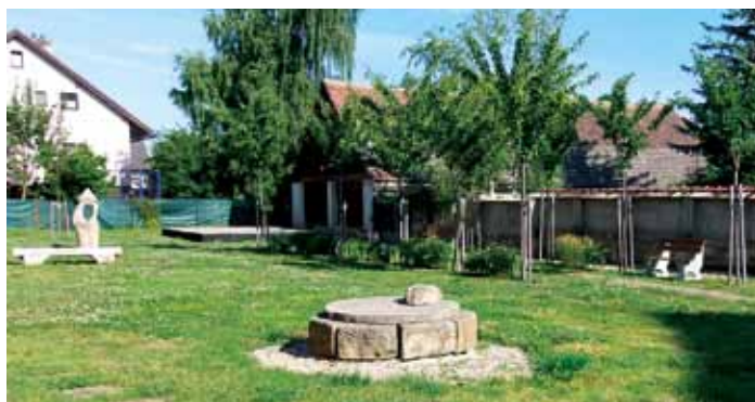
Zahrada knihovny vysázená při společném projektu občanů v roce 2011 již je nádherně vzrostlá, srpen 2014