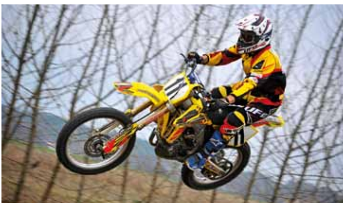
Z motokrosového tréninku