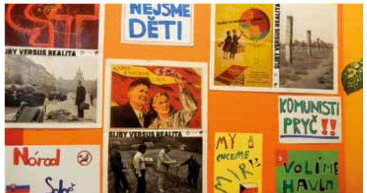
Projekt Naše Sametová revoluce, žáci 9. třídy, listopad 2014