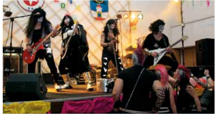
Karneval DBSK „navštívila“ i známá skupina KISS, 3. 3. 2014