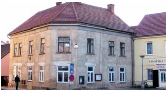
Nová MŠ na nám. TGM už má vyměněná okna, 4. 12.