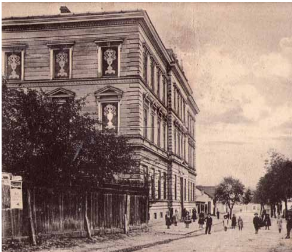
Stará fotografie původní podoby základní školy z roku 1894 před jejím rozšířením o druhý stupeň.

želka Kateřina ho následuje po čtvrt roce ve věku 36 let. V letech 1761 – 1769 jim zemřelo postupně 7 malých dětí. Nástup-