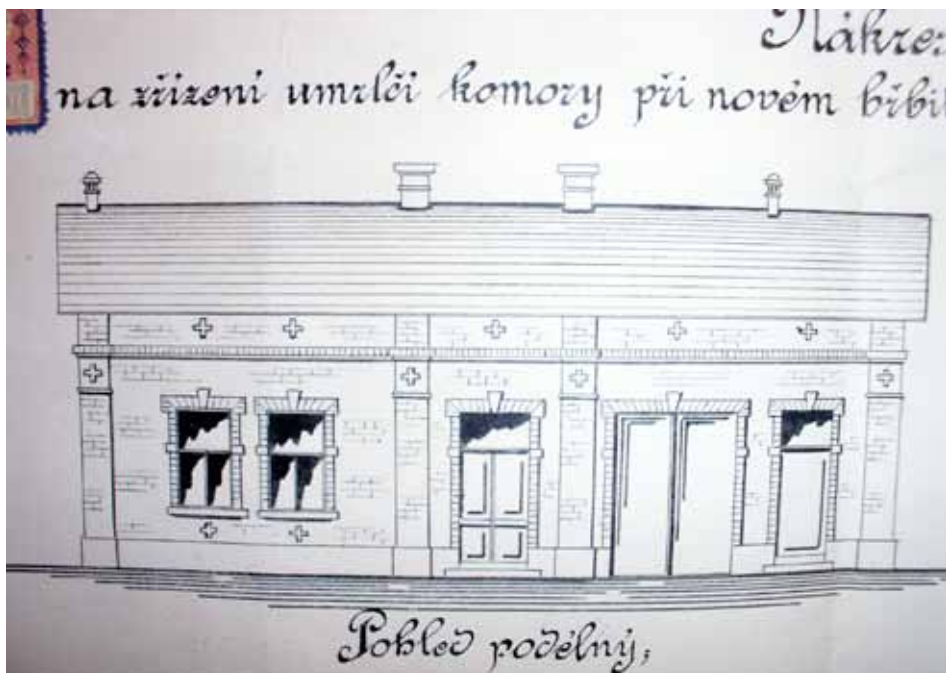
Projektová dokumentace ke stavbě márnice na novém hřbitově za Valchou.

Na výstavbu hřbitovni zdi bylo objednáno 30 tisíc cihel z Popovic. V roce 1915 byla postavena márnice s místností pro pitvy. Druhá místnost sloužila k úschově pohřebního vozu a byla zde ještě kůlna na nářadí hrobníka.