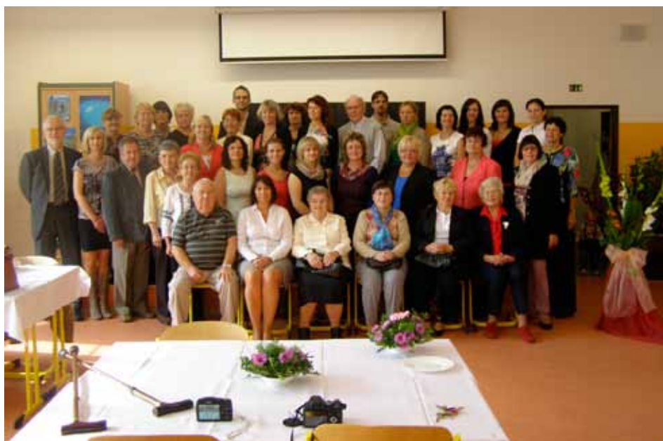
Učitelský sbor včetně bývalých kantorů vyfocený u příležitosti oslav 120. výročí otevření ZŠ.