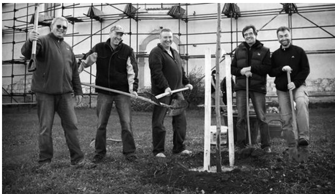
Bousovští radní zasadili dub červený, který byl vybrán jako Strom města Dolní Bousov.